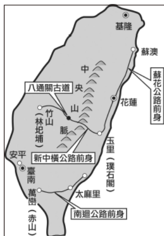
▲ 沈葆楨時期的建設